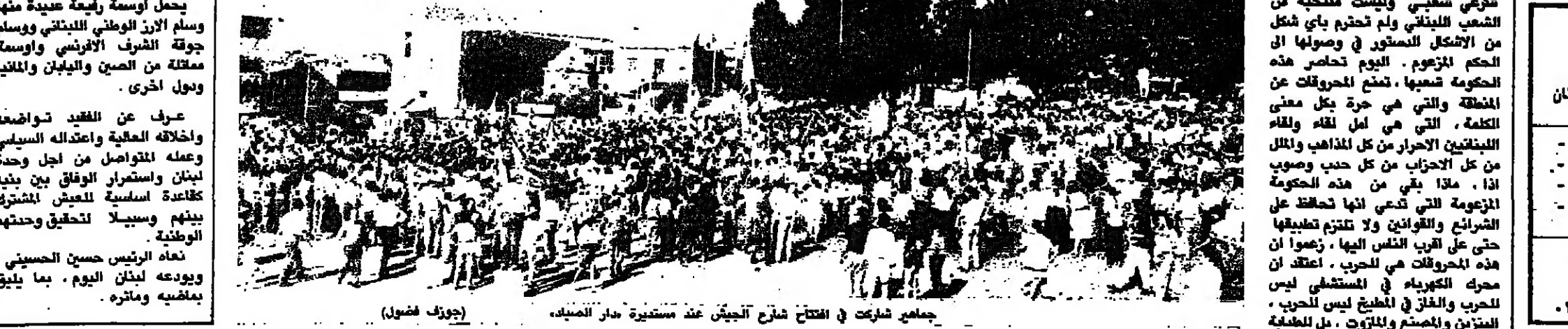
جامع شراكت في افتتاح شارع الجيش عند مستوية دار العميد